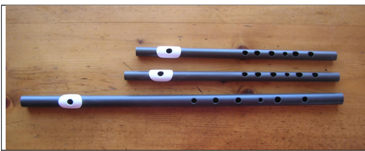
Fifres en bois : Olivier principalement